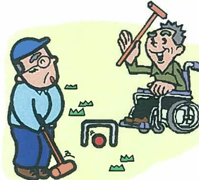
余暇や楽しみの援助