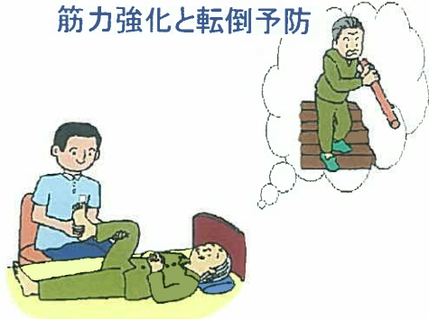
筋力強化と転倒予防