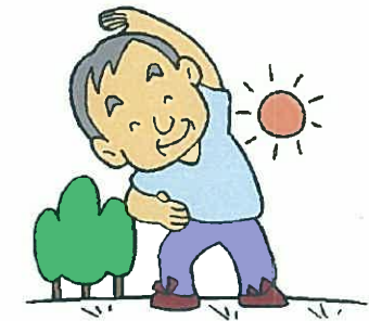
自主トレーニング指導