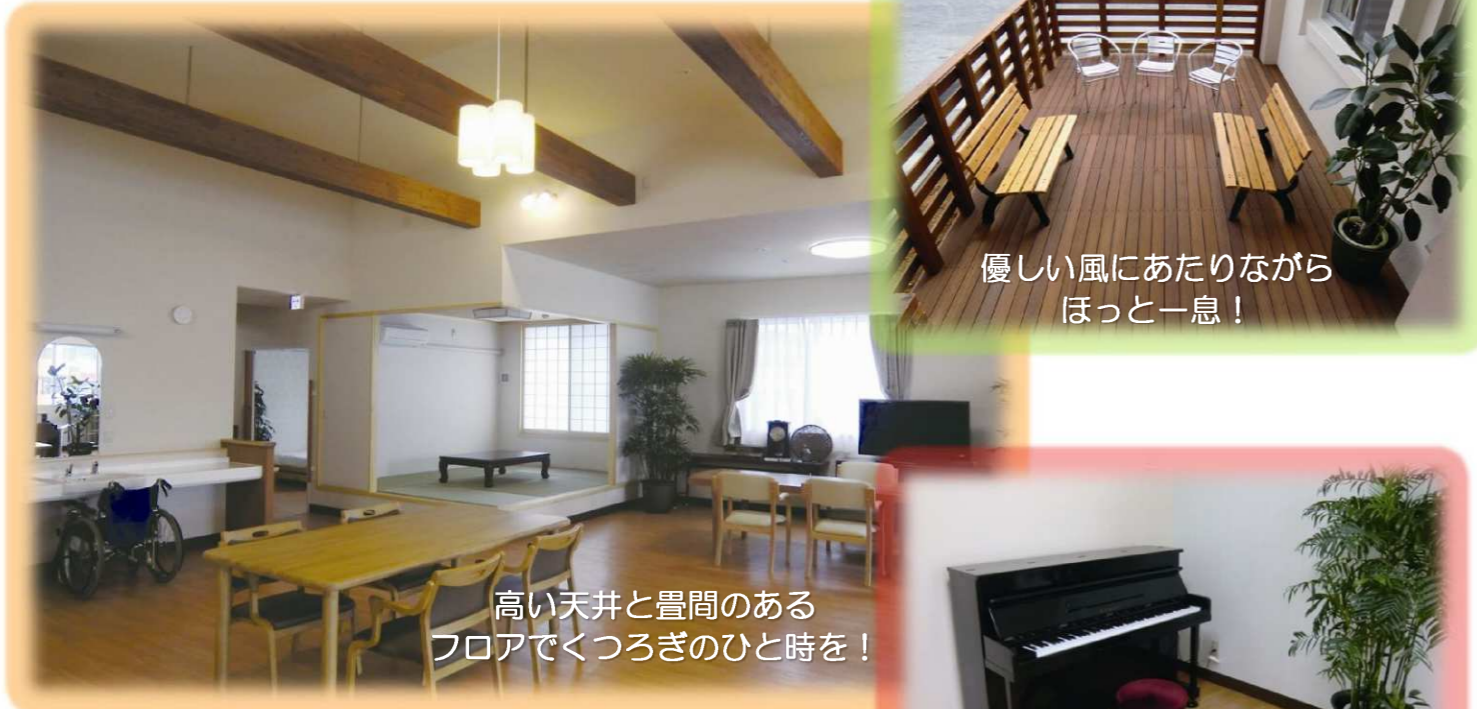
高い天井と畳間のある フロアでくつろぎのひと時を！