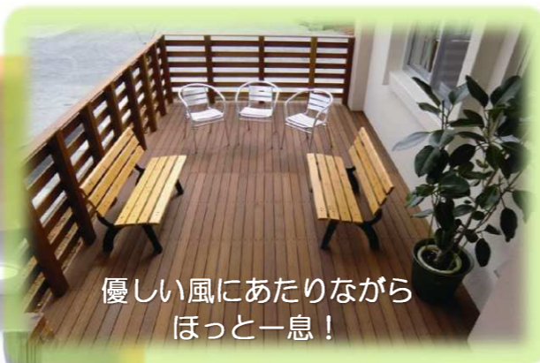
優しい風にあたりながら ほっと一息！