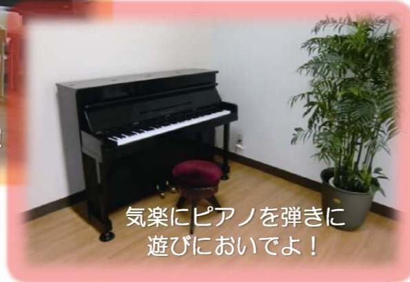
気楽にピアノを弾きに 遊びにおいでよ！